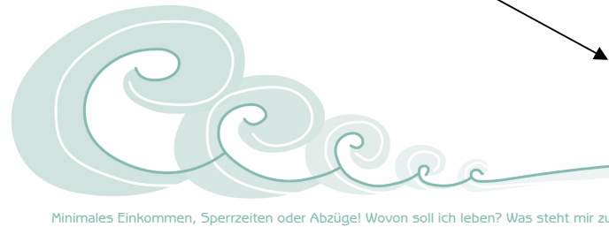
Minimales Einkommen, Sperrzeiten oder Abzüge! Wovon soll ich leben? Was steht mir zu?

Sozialhilfe Hartz IV ALG II Grundsicherung n SGB XII Wohngeld Rente